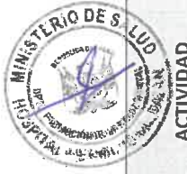
Matriz de Actividades